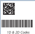
1D & 2D Codes